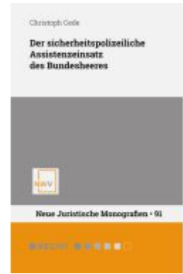
Der sicherheitspolizeiliche Assistenzeinsatz des Bundesheeres Ladenpreis: 68,00EUR