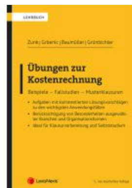
Übungen zur Kostenrechnung Ladenpreis: 39,00EUR