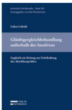
Gläubigergleichbehandlung außerhalb der Insolvenz Ladenpreis: 79,00EUR