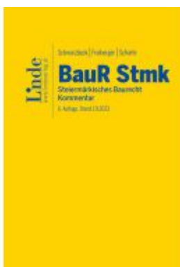
BauR Stmk. | Steiermärkisches Baurecht Ladenpreis: 249,00EUR