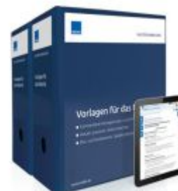
Vorlagen für das Notariat Ladenpreis: 261,80EUR