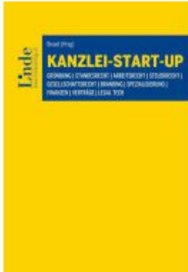
Kanzlei-Start-up Ladenpreis: 46,00EUR