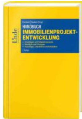
Handbuch Immobilienprojektentwicklung Ladenpreis: 108,00EUR