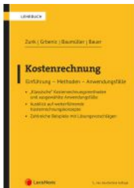
Kostenrechnung Ladenpreis: 48,00EUR