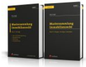
PAKET: Mustersammlung Immobilienrecht Ladenpreis: 88,80EUR

Wir haben andere Produkte gefunden, die Ihnen gefallen könnten!