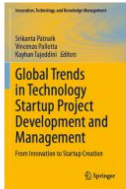
Global Trends in Technology Startup Project Development and Management Ladenpreis: 186,99EUR