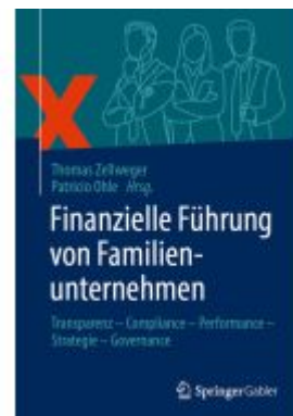
Finanzielle Führung von Familienunternehmen Ladenpreis: 35,97EUR