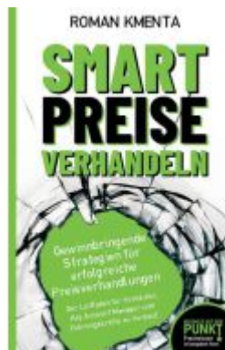
Smart Preise verhandeln - Gewinnbringende Strategien für erfolgreiche Preisverhandlungen Ladenpreis: 19,97EUR

Wir haben andere Produkte gefunden, die Ihnen gefallen könnten!