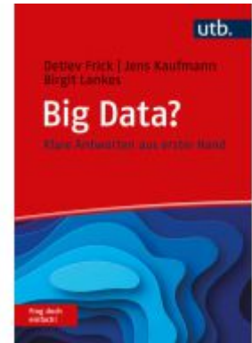
Big Data? Frag doch einfach! Ladenpreis: 18,40EUR