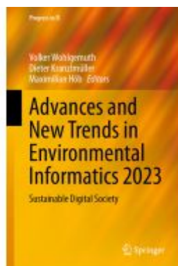
Advances and New Trends in Environmental Informatics 2023 Ladenpreis: 197,99EUR