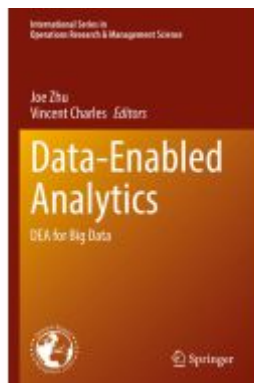
Data-Enabled Analytics Ladenpreis: 164,99EUR