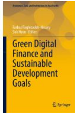
Green Digital Finance and Sustainable Development Goals Ladenpreis: 131,99EUR