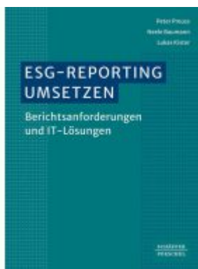
ESG-Reporting umsetzen Ladenpreis: 51,40EUR