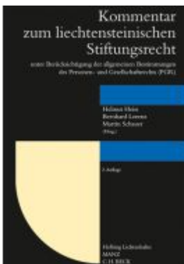
Kommentar zum liechtensteinischen Stiftungsrecht Ladenpreis: 348,00EUR

Wir haben andere Produkte gefunden, die Ihnen gefallen könnten!