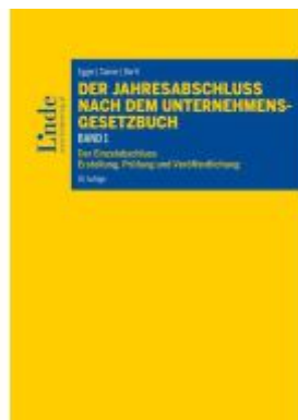
Der Jahresabschluss nach dem Unternehmensgesetzbuch, Band 1 Ladenpreis: 78,00EUR