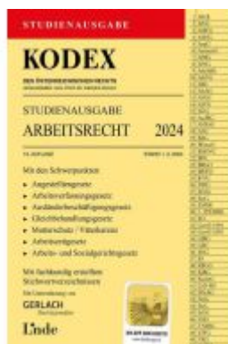
KODEX Studienausgabe Arbeitsrecht 2024 Ladenpreis: 15,00EUR