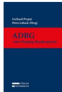
ADB - Anti-Doping-Bundesgesetz Ladenpreis: 179,00EUR