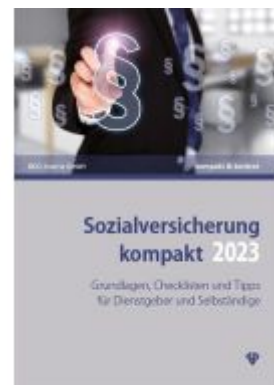
Sozialversicherung kompakt 2023 Ladenpreis: 29,70EUR