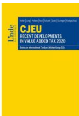
CJEU - Recent Developments in Value Added Tax 2020 Ladenpreis: 84,00EUR