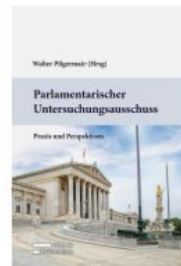
Parlamentarischer Untersuchungsausschuss Ladenpreis: 89,00EUR