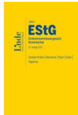
Jakom EstG | Einkommensteuergesetz 2023 Ladenpreis: 145,00EUR