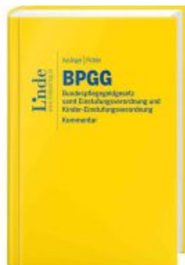
BPGG | Bundespflegegeldgesetz Ladenpreis: 59,00EUR