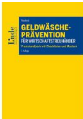
Geldwäscheprävention für Wirtschaftstreuhandler Ladenpreis: 34,00EUR