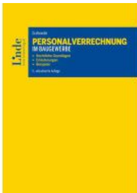
Personalverrechnung im Baugewerbe Ladenpreis: 74,00EUR

Wir haben andere Produkte gefunden, die Ihnen gefallen könnten!