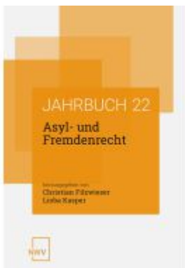
Asyl- und Fremdenrecht. Jahrbuch 2022 Ladenpreis: 84,00EUR