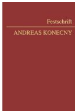
Festschrift Konecny Ladenpreis: 178,00EUR