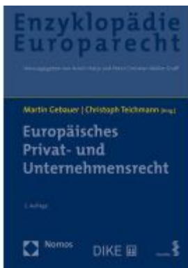
Europäisches Privat- und Unternehmensrecht Ladenpreis: 193,30EUR