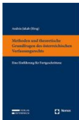
Methoden und theoretische Grundfragen des österreichischen Verfassungsrechts Ladenpreis: 59,00EUR