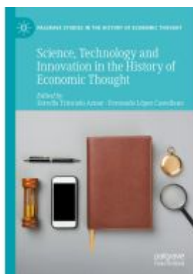
Science, Technology and Innovation in the History of Economic Thought Ladenpreis: 197,99EUR