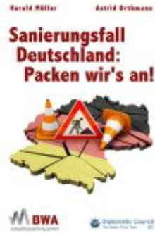
Sanierungsfall Deutschland: Packen wir's an! Ladenpreis: 25,70EUR