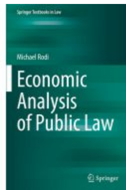
Economic Analysis of Public Law Ladenpreis: 93,49EUR