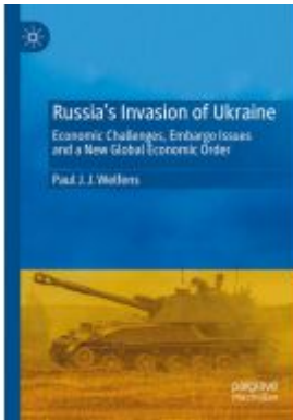
Russia's Invasion of Ukraine Ladenpreis: 142,99EUR