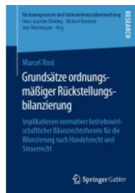
Grundsätze ordnungsmäßiger Rückstellungsbilanzierung Ladenpreis: 77,09EUR