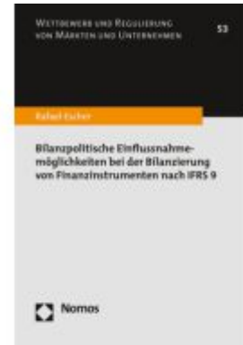
Bilanzpolitische Einflussnahmemöglichkeiten bei der Bilanzierung von Finanzinstrumenten nach IFRS 9 Ladenpreis: 81,30EUR