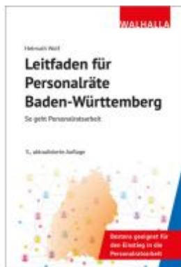
Leitfaden für Personalräte Baden- Württemberg Ladenpreis: 36,00EUR