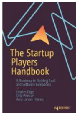
The Startup Players Handbook Ladenpreis: 49,49EUR

Wir haben andere Produkte gefunden, die Ihnen gefallen könnten!