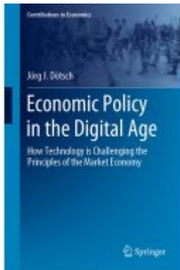
Economic Policy in the Digital Age Ladenpreis: 131,99EUR