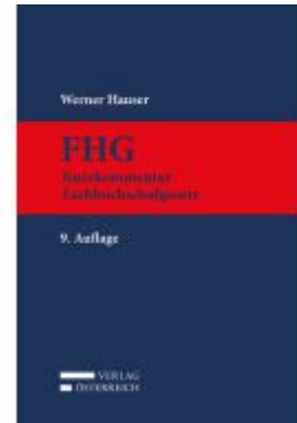
FHG Ladenpreis: 379,00EUR