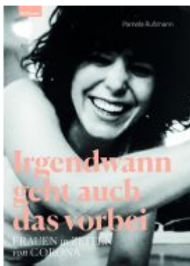
Irgendwann geht auch das vorbei Ladenpreis: 24,00EUR

Wir haben andere Produkte gefunden, die Ihnen gefallen könnten!