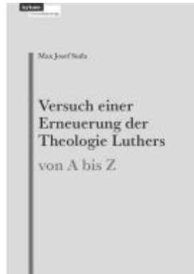
Versuch einer Erneuerung der Theologie Luthers Ladenpreis: 29,00EUR