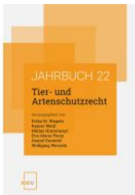
Tier- und Artenschutzrecht Ladenpreis: 84,00EUR