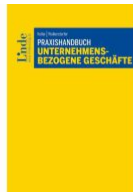
Praxishandbuch Unternehmensbezogene Geschäfte Ladenpreis: 48,00EUR