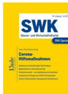
SWK-Spezial Corona-Hilfsmaßnahmen Ladenpreis: 60,00EUR