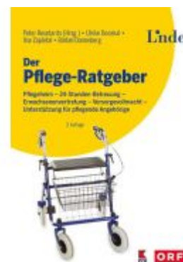
Der Pflege-Ratgeber Ladenpreis: 29,90EUR