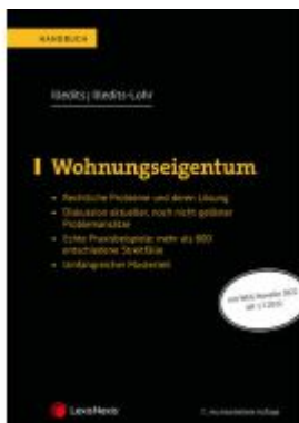
Wohnungseigentum Ladenpreis: 99,00EUR

Wir haben andere Produkte gefunden, die Ihnen gefallen könnten!