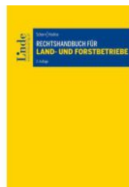
Rechtshandbuch für Land- und Forstbetriebe Ladenpreis: 58,00EUR