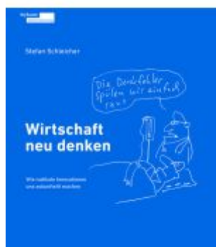
Wirtschaft neu denken Ladenpreis: 25,00EUR