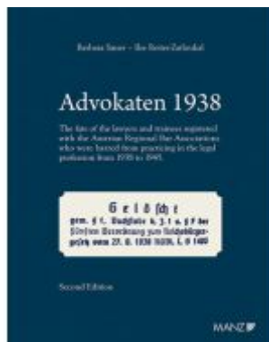
Advokaten 1938 English edition Ladenpreis: 78,00EUR