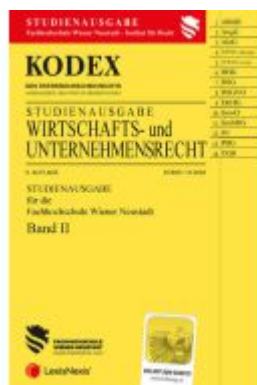
KODEX Wirtschafts- und Unternehmensrecht 2023 Band II - inkl. App Ladenpreis: 22,50EUR