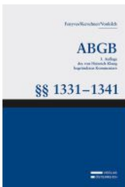
Großkommentar zum ABGB - Klang Kommentar Ladenpreis: 208,00EUR