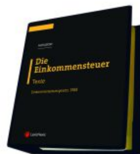
Die Einkommensteuer (EStG 1988) Band I - Texte Ladenpreis: 298,00EUR