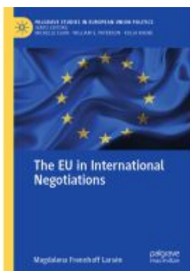
The EU in International Negotiations Ladenpreis: 142,99EUR