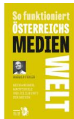
So funktioniert Österreichs Medienwelt Ladenpreis: 24,90EUR