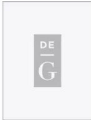
Völkerrecht in Fragen und Antworten Ladenpreis: 24,95EUR