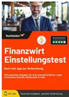
Finanzwirt Einstellungstest: Buch inkl. App zur Vorbereitung - Mit tausenden Aufgaben für dein Auswahlverfahren: Logik, Fachwissen, Sprache, Mathematik & mehr Ladenpreis: 41,10EUR