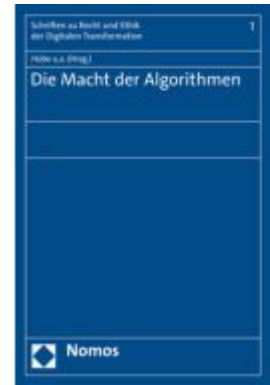
Die Macht der Algorithmen Ladenpreis: 45,30EUR