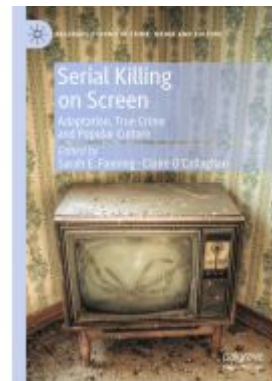
Serial Killing on Screen Ladenpreis: 153,99EUR