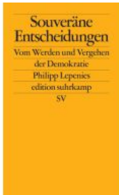
Souveräne Entscheidungen Ladenpreis: 18,50EUR