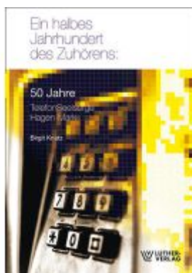
Ein halbes Jahrhundert des Zuhörens Ladenpreis: 15,50EUR