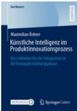
Künstliche Intelligenz im Produktinnovationsprozess Ladenpreis: 71,95EUR