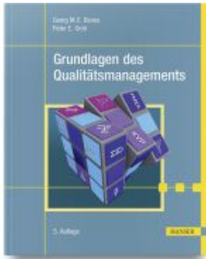
Grundlagen des Qualitätsmanagements Ladenpreis: 41,20EUR