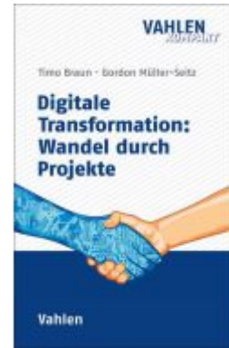
Digitale Transformation: Wandel durch Projekte Ladenpreis: 20,40EUR