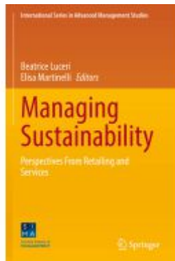
Managing Sustainability Ladenpreis: 109,99EUR