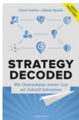
Strategy decoded Ladenpreis: 40,10EUR