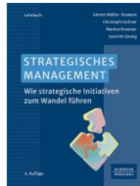
Strategisches Management Ladenpreis: 61,70EUR