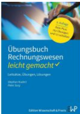
Übungsbuch Rechnungswesen – leicht gemacht Ladenpreis: 17,40EUR

Wir haben andere Produkte gefunden, die Ihnen gefallen könnten!