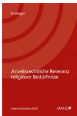
Arbeitsrechtliche Relevanz religiöser Bedürfnisse Ladenpreis: 74,00 EUR