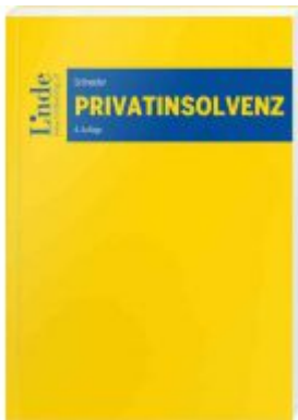
Privatinsolvenz Ladenpreis: 52,00 EUR