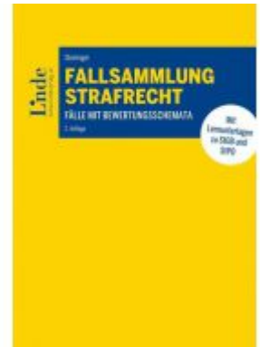
Fallsammlung Strafrecht Ladenpreis: 42,00 EUR