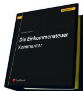
Die Einkommensteuer (EStG 1988) Band III - Kommentar Ladenpreis: 496,00 EUR