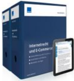
Internetrecht und E-Commerce Ladenpreis: 249,90 EUR