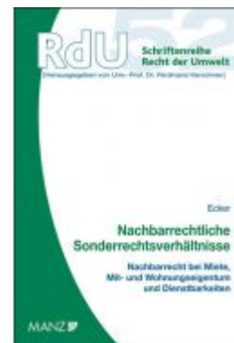
Nachbarrechtliche Sonderrechtsverhältnisse Ladenpreis: 54,00 EUR