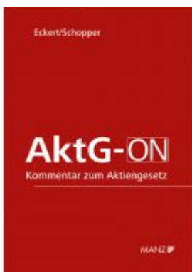
AktG-ON Aktionspreis: 248,00 EUR Ladenpreis: 298,00 EUR