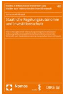
Staatliche Regelungsautonomie und Investitionsschutz Ladenpreis: 63,80 EUR