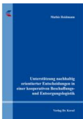
Unterstützung nachhaltig orientierter Entscheidungen in einer kooperativen Beschaffungs- und Entsorgungslogistik Ladenpreis: 101,60EUR