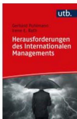
Herausforderungen des Internationalen Managements Ladenpreis: 20,50EUR