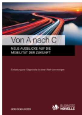
Von A nach C Ladenpreis: 24,20EUR