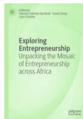
Exploring Entrepreneurship Ladenpreis: 219,99EUR