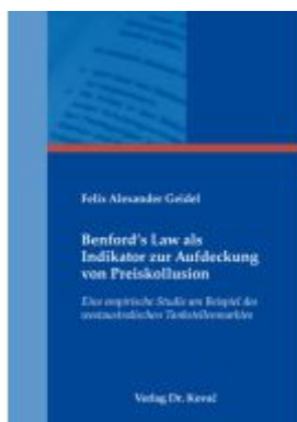
Benford's Law als Indikator zur Aufdeckung von Preiskollusion Ladenpreis: 143,80EUR