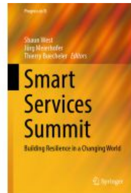
Smart Services Summit Ladenpreis: 197,99EUR