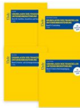
Grundlagen der finanziellen Unternehmensführung, Band I-IV Ladenpreis: 158,00EUR