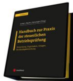
Handbuch zur Praxis der steuerlichen Betriebsprüfung Ladenpreis: 440,00EUR