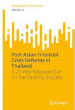
Post-Asian Financial Crisis Reforms in Thailand Ladenpreis: 54,99EUR