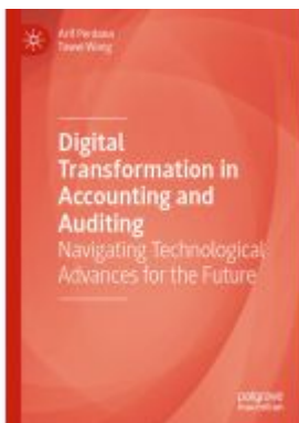
Digital Transformation in Accounting and Auditing Ladenpreis: 175,99EUR