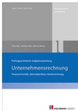
Prüfungsorientierte Aufgabensammlung "Unternehmensrechnung" Ladenpreis: 20,50EUR