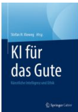
KI für das Gute Ladenpreis: 66,81EUR