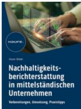
Nachhaltigkeitsberichterstattung in mittelständischen Unternehmen Ladenpreis: 61,70EUR

Wir haben andere Produkte gefunden, die Ihnen gefallen könnten!