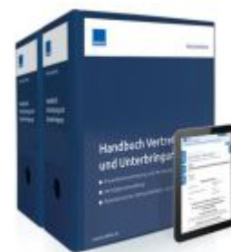
Handbuch Vertretung und Unterbringung Ladenpreis: 261,80EUR