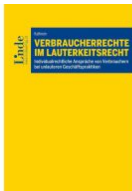
Verbraucherrechte im Lauterkeitsrecht Ladenpreis: 59,00EUR