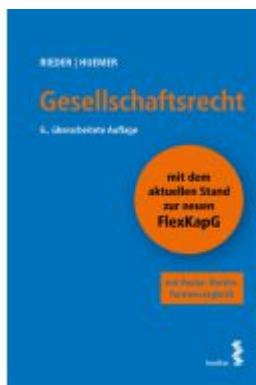
Gesellschaftsrecht Ladenpreis: 52,00EUR