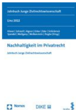
Nachhaltigkeit im Privatrecht Ladenpreis: 86,40EUR