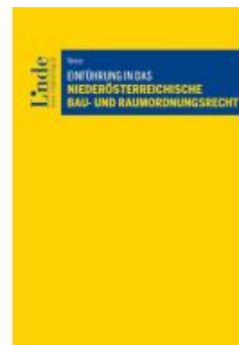
Einführung in das niederösterreichische Bau- und Raumordnungsrecht Ladenpreis: 56,00EUR