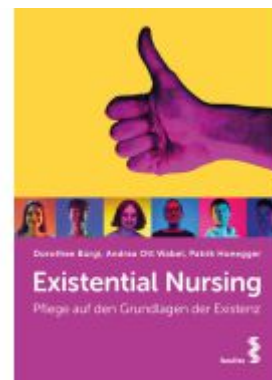
Existential Nursing Ladenpreis: 24,90EUR