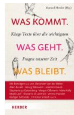
Was kommt. Was geht. Was bleibt. Ladenpreis: 36,00EUR