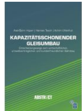
Kapazitätsschonender Gleisumbau Ladenpreis: 40,10EUR