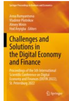
Challenges and Solutions in the Digital Economy and Finance Ladenpreis: 252,99EUR