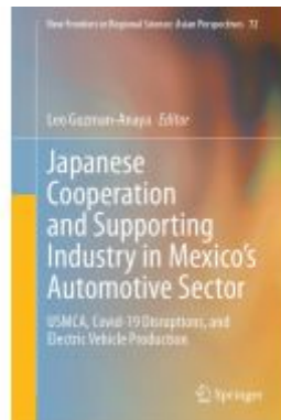
Japanese Cooperation and Supporting Industry in Mexico's Automotive Sector Ladenpreis: 164,99EUR