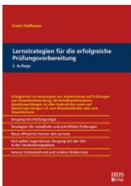
Lernstrategien für die erfolgreiche Prüfungsvorbereitung Ladenpreis: 56,50EUR