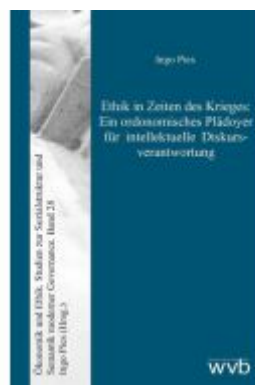
Ethik in Zeiten des Krieges: Ein ordonomisches Plädoyer für intellektuelle Diskursverantwortung Ladenpreis: 20,50EUR