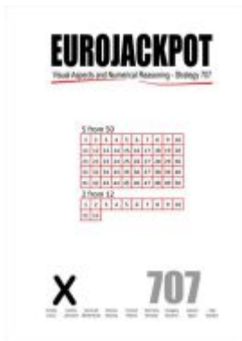
Eurojackpot Ladenpreis: 39,90EUR