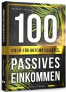
100 Ideen für automatisiertes, passives Einkommen Ladenpreis: 20,50EUR