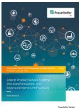
Smarte Produkt-Service Systeme: Eine transformations- und kostenorientierte Untersuchung