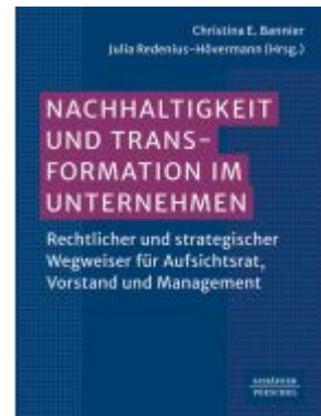
Nachhaltigkeit und Transformation im Unternehmen