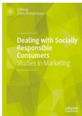
Dealing with Socially Responsible Consumers