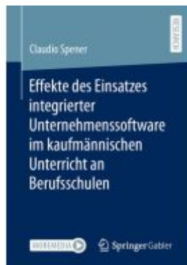
Effekte des Einsatzes integrierter Unternehmenssoftware im kaufmännischen Unterricht an Berufsschulen