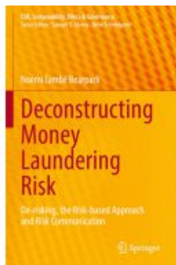
Deconstructing Money Laundering Risk