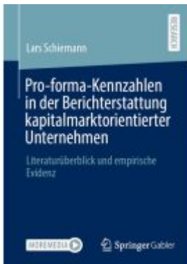
Pro-forma-Kennzahlen in der Berichterstattung kapitalmarktorientierter Unternehmen

Wir haben andere Produkte gefunden, die Ihnen gefallen könnten!