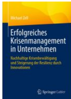
Erfolgreiches Krisenmanagement in Unternehmen