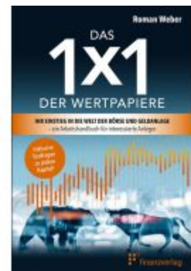
Das 1x1 der Wertpapiere