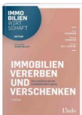
Immobilien vererben und verschenken Ladenpreis: 34,00EUR