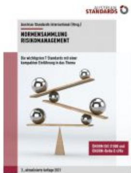
Normensammlung Risikomanagement Ladenpreis: 241,50EUR