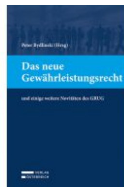
Das neue Gewährleistungsrecht Ladenpreis: 59,00EUR