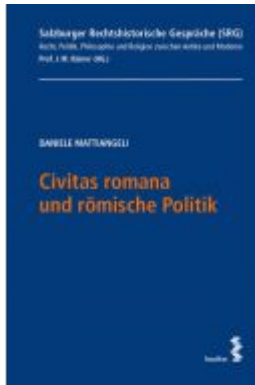
Civitas romana und römische Politik Ladenpreis: 46,00EUR