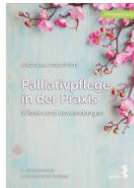
Palliativpflege in der Praxis Ladenpreis: 24,90EUR