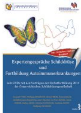
Expertengespräche Schilddrüse und Fortbildung Autoimmunerkrankungen Ladenpreis: 19,90EUR