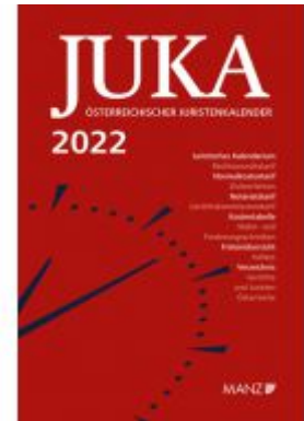
Österreichischer Juristenkalender 2022 JuKa Ladenpreis: 131,00EUR