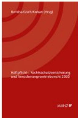
Haftpflicht-, Rechtsschutzversicherung und Versicherungsvertriebsrecht 2020 6. Kremser Versicherungsforum 2020 Ladenpreis: 48,00EUR