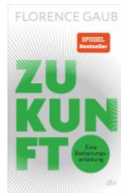
Zukunft Ladenpreis: 23,70EUR