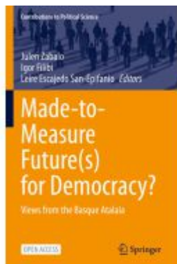
Made-to-Measure Future(s) for Democracy? Ladenpreis: 43,99EUR