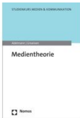
Medientheorie Ladenpreis: 24,70EUR