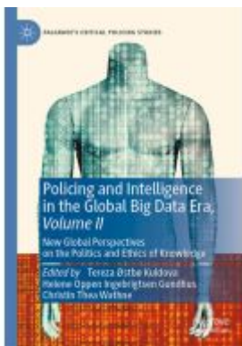
Policing and Intelligence in the Global Big Data Era, Volume II Ladenpreis: 153,99EUR