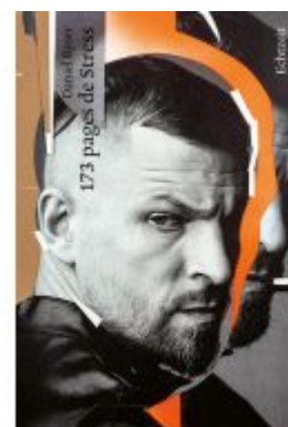
173 pages de Stress Ladenpreis: 35,00EUR