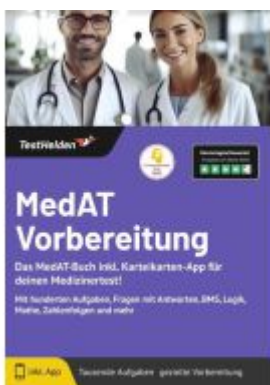
MedAT Vorbereitung: Das MedAT-Buch inkl. Karteikarten-App für deinen Medizintest! Mit hunderten Aufgaben, Fragen mit Antworten, BMS, Logik, Mathe, Zahlenfolgen und mehr Ladenpreis: 41,10EUR