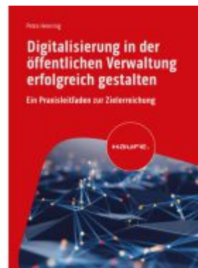
Digitalisierung in der öffentlichen Verwaltung erfolgreich gestalten Ladenpreis: 51,40EUR