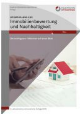
Normensammlung Immobilienbewertung und Nachhaltigkeit Ladenpreis: 306,90 EUR