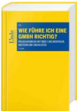
Wie führe ich eine GmbH richtig? Ladenpreis: 168,00 EUR

Wir haben andere Produkte gefunden, die Ihnen gefallen könnten!