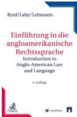
Einführung in die anglo-amerikanische Rechtssprache Ladenpreis: 39,00 EUR