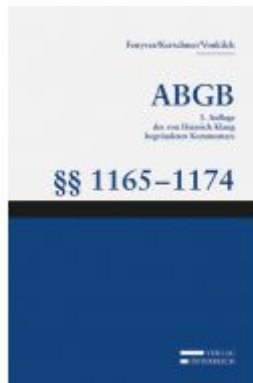
Großkommentar zum ABGB - Klang Kommentar Ladenpreis: 199,00 EUR