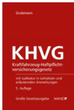
Kraftfahrzeug-Haftpflichtversicherungsgesetz KHVG Ladenpreis: 118,00 EUR