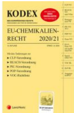
KODEX EU-Chemikalienrecht 2020/21 Ladenpreis: 95,00 EUR