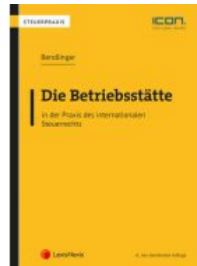
Die Betriebsstätte in der Praxis des internationalen Steuerrechts Ladenpreis: 86,00 EUR