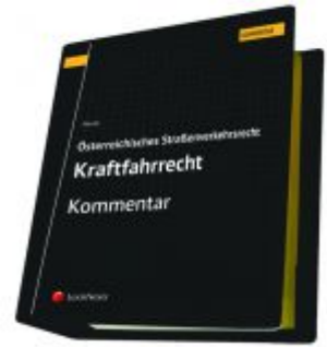
Österreichisches Straßenverkehrsrecht - Kraftfahrrecht Ladenpreis: 487,00 EUR