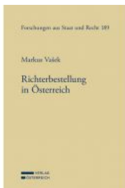
Richterbestellung in Österreich Ladenpreis: 114,00EUR