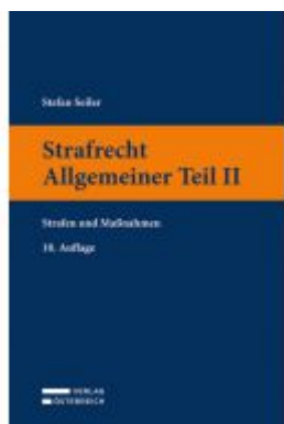
Strafrecht Allgemeiner Teil II Ladenpreis: 23,00EUR