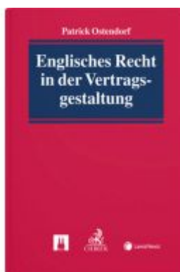
Englisches Recht in der Vertragsgestaltung Ladenpreis: 79,00EUR