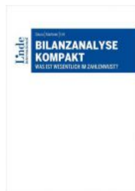
Bilanzanalyse kompakt Ladenpreis: 38,00EUR