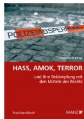
Hass, Amok, Terror und ihre Bekämpfung mit den Mitteln des Rechts Ladenpreis: 64,00EUR