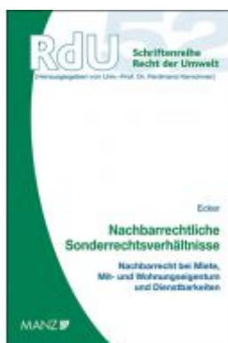
Nachbarrechtliche Sonderrechtsverhältnisse Ladenpreis: 54,00EUR