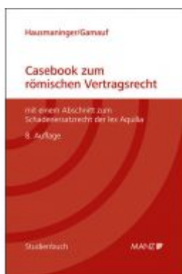
Casebook zum römischen Vertragsrecht Ladenpreis: 44,40EUR