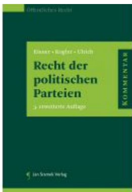
Recht der politischen Parteien Ladenpreis: 174,00EUR

Wir haben andere Produkte gefunden, die Ihnen gefallen könnten!