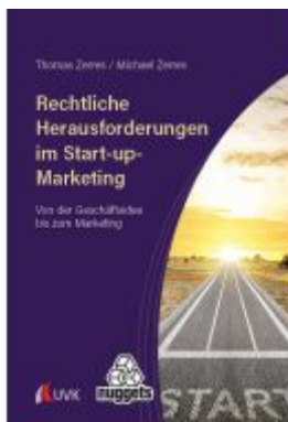
Rechtliche Herausforderungen im Start-up-Marketing