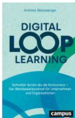
Digital Loop Learning