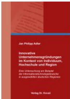
Innovative Unternehmensgründungen im Kontext von Individuum, Hochschule und Region