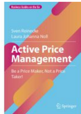
Active Price Management