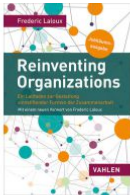
Reinventing Organizations Ladenpreis: 30,70EUR