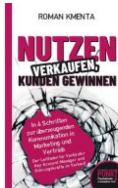
Nutzen verkaufen, Kunden gewinnen Ladenpreis: 15,98EUR