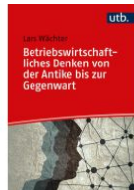
Betriebswirtschaftliches Denken von der Antike bis zur Gegenwart