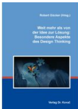
Weit mehr als von der Idee zur Lösung: Besondere Aspekte des Design Thinking Ladenpreis: 79,10EUR

Wir haben andere Produkte gefunden, die Ihnen gefallen könnten!