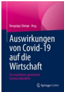
Auswirkungen von Covid-19 auf die Wirtschaft Ladenpreis: 61,68EUR