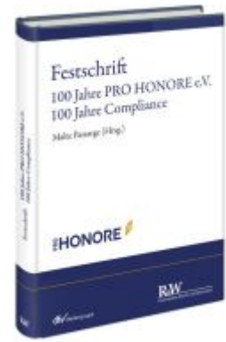
Festschrift 100 Jahre PRO HONORE e. V. - 100 Jahre Compliance Ladenpreis: 91,50EUR