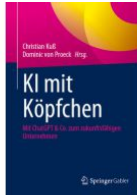
KI mit Köpfchen Ladenpreis: 51,39EUR