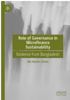
Role of Governance in Microfinance Sustainability Ladenpreis: 131,99EUR