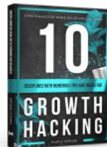
10 Disciplines With Numerous Tips and Tricks for Growth Hacking Ladenpreis: 20,50EUR