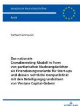
Das nationale Crowdfunding-Modell in Form von partiarischen Nachrangdarlehen als Finanzierungsvariante für Startups und dessen rechtliche Kompatibilität mit den Beteiligungsgrundsätzen von Venture Capital-Gebern Ladenpreis: 92,50EUR