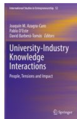
University-Industry Knowledge Interactions Ladenpreis: 120,99EUR