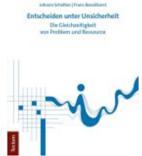
Entscheiden unter Unsicherheit Ladenpreis: 40,10EUR