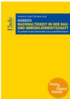
Handbuch Nachhaltigkeit in der Bau- und Immobilienwirtschaft (Kombi Print&digital) Ladenpreis: 124,00EUR