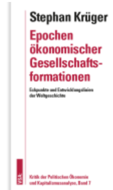
Epochen ökonomischer Gesellschaftsformationen Ladenpreis: 51,20EUR