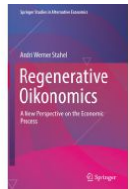
Regenerative Oikonomics Ladenpreis: 120,99EUR