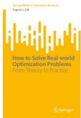
How to Solve Real-world Optimization Problems Ladenpreis: 49,49EUR