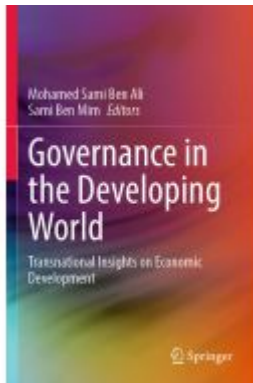
Governance in the Developing World Ladenpreis: 153,99EUR