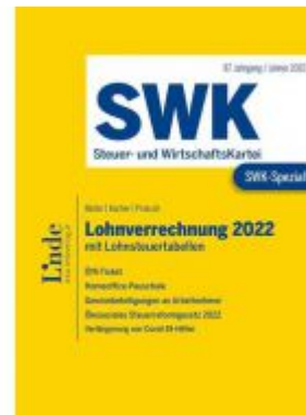
SWK-Spezial Lohnverrechnung 2022 Ladenpreis: 48,00 EUR