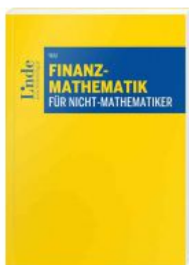
Finanzmathematik für Nicht-Mathematiker Ladenpreis: 42,00 EUR