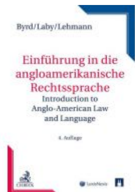
Einführung in die anglo-amerikanische Rechtssprache Ladenpreis: 39,00 EUR