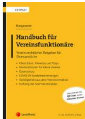
Handbuch für Vereinsfunktionäre Ladenpreis: 49,00 EUR