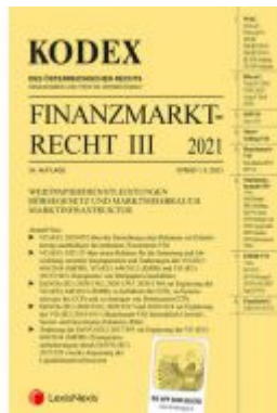
Kodex Finanzmarktrecht Band III 2021 Ladenpreis: 81,00 EUR

Wir haben andere Produkte gefunden, die Ihnen gefallen könnten!