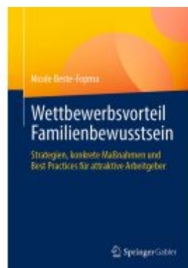
Wettbewerbsvorteil Familienbewusstsein Ladenpreis: 46,25EUR