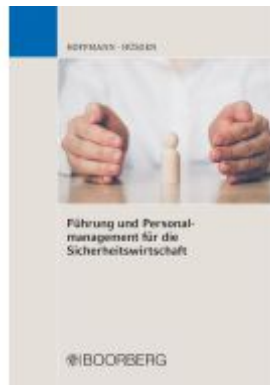
Führung und Personalmanagement für die Sicherheitswirtschaft Ladenpreis: 37,10EUR