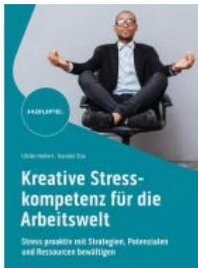
Kreative Stresskompetenz für die Arbeitswelt Ladenpreis: 51,40EUR