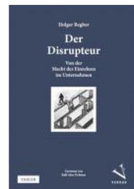
Der Disrupteur Ladenpreis: 24,90EUR