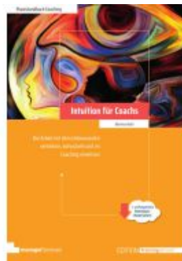
Intuition für Coaches Ladenpreis: 51,30EUR