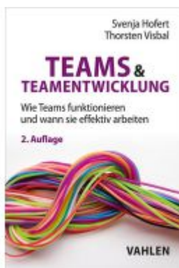
Teams & Teamentwicklung Ladenpreis: 33,90EUR