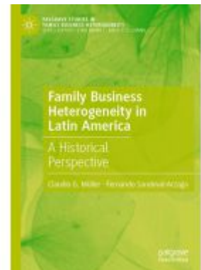
Family Business Heterogeneity in Latin America Ladenpreis: 142,99EUR