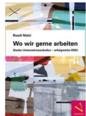
Wo wir gerne arbeiten Ladenpreis: 29,00EUR