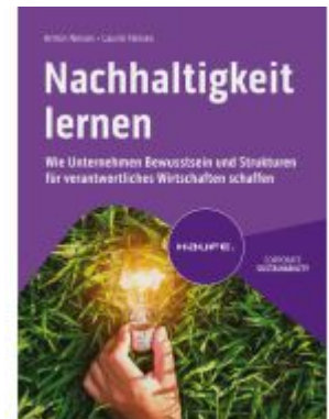
Nachhaltigkeit lernen Ladenpreis: 41,20EUR