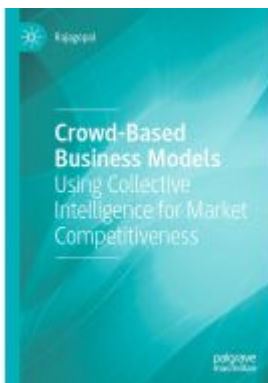
Crowd-Based Business Models Ladenpreis: 164,99EUR