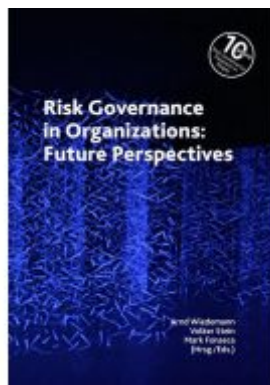
Risk Governance in Organizations: Future Perspectives Ladenpreis: 39,90EUR