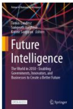
Future Intelligence Ladenpreis: 54,99EUR