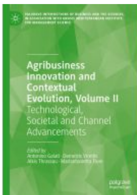
Agribusiness Innovation and Contextual Evolution, Volume II Ladenpreis: 164,99EUR