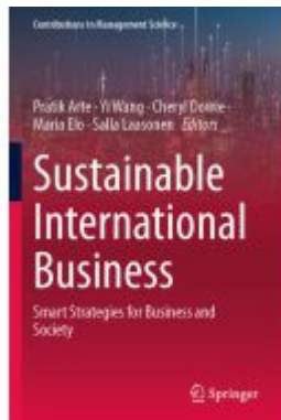
Sustainable International Business Ladenpreis: 164,99EUR

Wir haben andere Produkte gefunden, die Ihnen gefallen könnten!