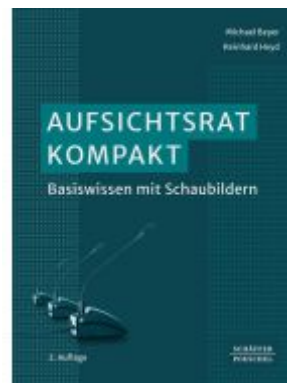
Aufsichtsrat kompakt Ladenpreis: 51,40EUR