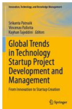
Global Trends in Technology Startup Project Development and Management Ladenpreis: 186,99EUR