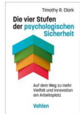
Die vier Stufen der psychologischen Sicherheit Ladenpreis: 30,70EUR