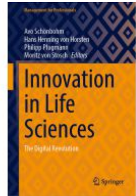
Innovation in Life Sciences Ladenpreis: 93,49EUR