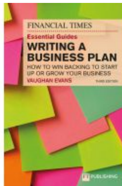
The Financial Times Essential Guide to Writing a Business Plan: How to win backing to start up or grow your business Ladenpreis: 26,74EUR