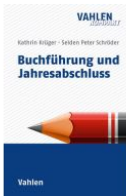
Buchführung und Jahresabschluss Ladenpreis: 23,60EUR