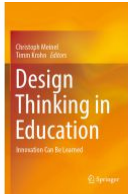
Design Thinking in Education Ladenpreis: 65,99EUR