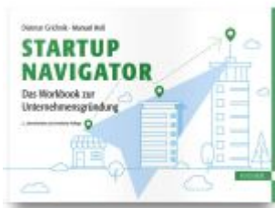
Startup Navigator – Das Workbook zur Unternehmensgründung Ladenpreis: 51,40EUR