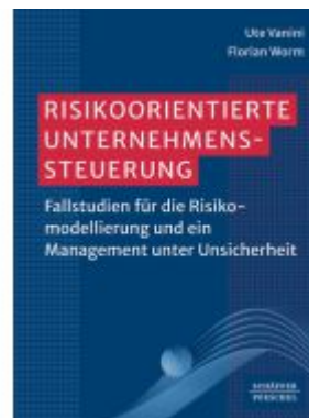
Risikoorientierte Unternehmenssteuerung Ladenpreis: 61,70EUR