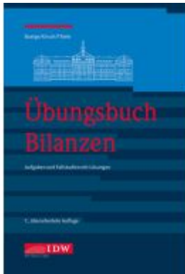
Übungsbuch Bilanzen, 7. Ladenpreis: 44,30EUR