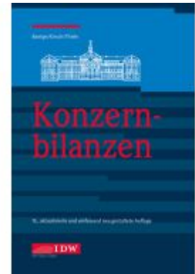
Konzernbilanzen, 15. Auflage Ladenpreis: 49,40EUR