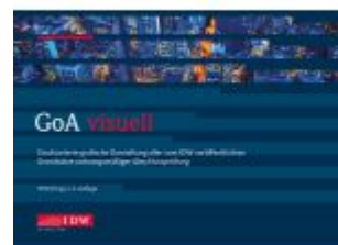
GoA visuell Ladenpreis: 60,70EUR