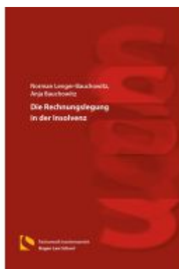
Die Rechnungslegung in der Insolvenz Ladenpreis: 25,70EUR