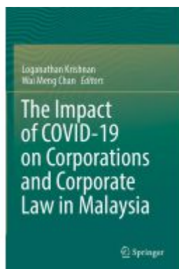
The Impact of COVID-19 on Corporations and Corporate Law in Malaysia Ladenpreis: 153,99EUR