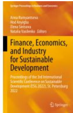
Finance, Economics, and Industry for Sustainable Development Ladenpreis: 252,99EUR