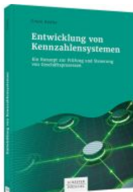
Entwicklung von Kennzahlensystemen Ladenpreis: 51,40EUR