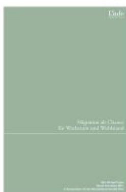
Migration als Chance für Wachstum und Wohlstand Ladenpreis: 48,00EUR