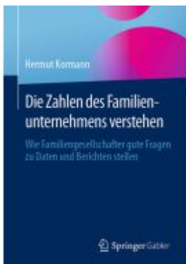
Die Zahlen des Familienunternehmens verstehen Ladenpreis: 51,39EUR