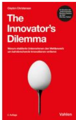
The Innovator's Dilemma Ladenpreis: 35,90EUR