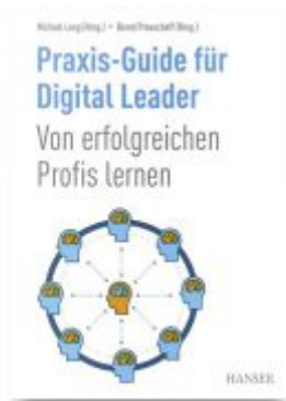
Praxis-Guide für Digital Leader Ladenpreis: 61,70EUR