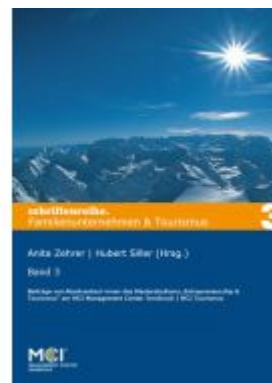
Familienunternehmen & Tourismus Ladenpreis: 19,90EUR