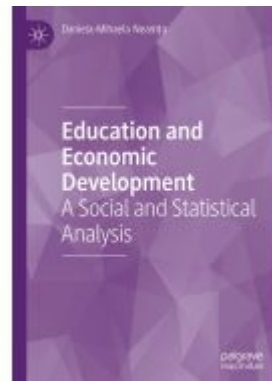
Education and Economic Development Ladenpreis: 131,99EUR