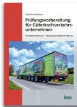
Prüfungsvorbereitung für Güterkraftverkehrsunternehmen Ladenpreis: 25,10EUR