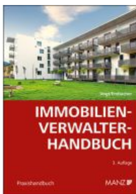
Immobilienverwalter-Handbuch Ladenpreis: 58,00EUR