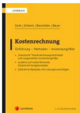
Kostenrechnung Ladenpreis: 48,00EUR