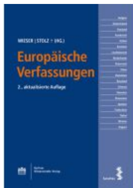
Europäische Verfassungen Ladenpreis: 36,00EUR