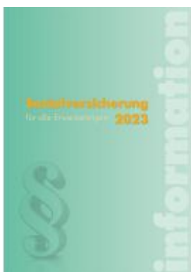
Sozialversicherung 2023 Ladenpreis: 49,50EUR