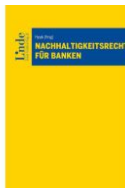
Nachhaltigkeitsrecht für Banken Ladenpreis: 88,00EUR