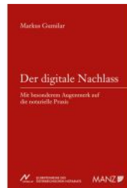
Der digitale Nachlass Ladenpreis: 54,00EUR