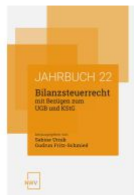
Bilanzsteuerrecht mit Bezügen zum UGB und KStG Ladenpreis: 62,00EUR