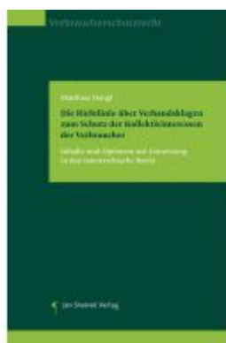
Die Richtlinie über Verbandsklagen zum Schutz der Kollektivinteressen der Verbraucher Ladenpreis: 85,00EUR