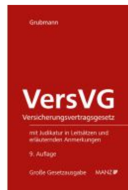
Versicherungsvertragsgesetz VersVG Ladenpreis: 268,00EUR