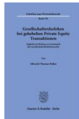
Gesellschafterdarlehen bei gehebelten Private Equity Transaktionen. Ladenpreis: 102,70EUR