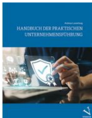
Handbuch der praktischen Unternehmensführung Ladenpreis: 46,00EUR