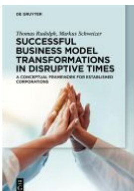
Successful Business Model Transformations in Disruptive Times Ladenpreis: 29,95EUR