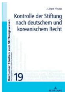
Kontrolle der Stiftung nach deutschem und koreanischem Recht Ladenpreis: 68,80EUR