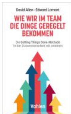
Wie wir im Team die Dinge geregelt bekommen Ladenpreis: 27,70EUR