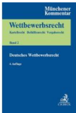
Münchener Kommentar zum Wettbewerbsrecht Bd. 2: Gesetz gegen Wettbewerbsbeschränkungen (GWB) §§ 1-96, 185, 186 Ladenpreis: 307,40EUR

Wir haben andere Produkte gefunden, die Ihnen gefallen könnten!