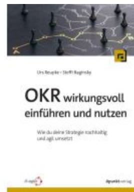
OKR wirkungsvoll einführen und nutzen Ladenpreis: 30,80EUR