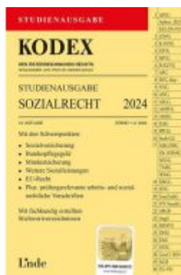
KODEX Studienausgabe Sozialrecht 2024 Ladenpreis: 15,00EUR