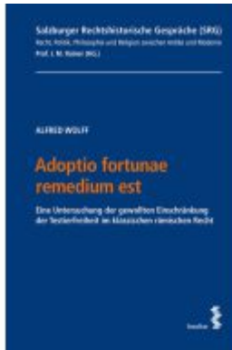
Adoptio fortunae remedium est Ladenpreis: 63,00EUR

ICH ARBEITE NICHT MEHR - JETZT BIN ICH TÄTIG