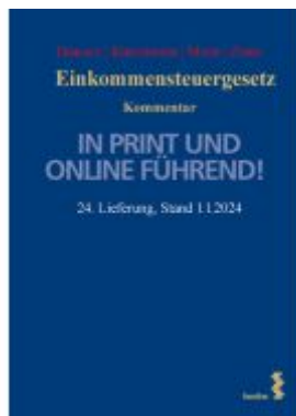
Einkommensteuergesetz Ladenpreis: 182,00EUR