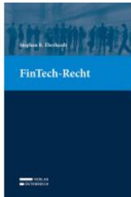
FinTech-Recht Ladenpreis: 64,00EUR