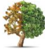
Ich arbeite nicht mehr - Jetzt bin ich tätig Ladenpreis: 22,00EUR

ICH ARBEITE NICHT MEHR - JETZT BIN ICH TÄTIG