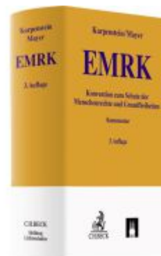
EMRK Ladenpreis: 139,00EUR