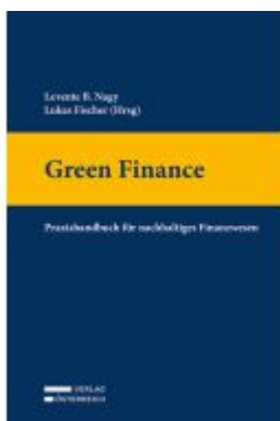
Green Finance Ladenpreis: 69,00EUR