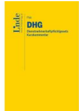
DHG I Dienstnehmerhaftpflichtgesetz Ladenpreis: 48,00EUR