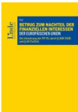
Betrug zum Nachteil der finanziellen Interessen der Europäischen Union Ladenpreis: 59,00EUR

Wir haben andere Produkte gefunden, die Ihnen gefallen könnten!