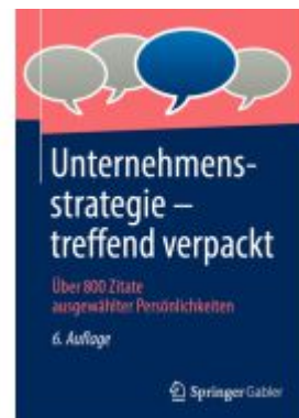
Unternehmensstrategie – treffend verpackt Ladenpreis: 66,81EUR