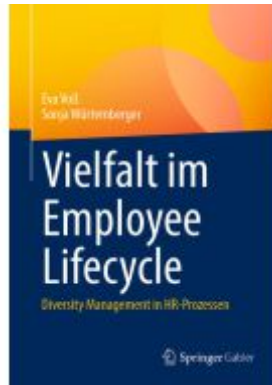
Vielfalt im Employee Lifecycle Ladenpreis: 46,25EUR