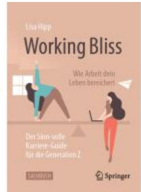
Working Bliss: Wie Arbeit dein Leben bereichert Ladenpreis: 30,90EUR