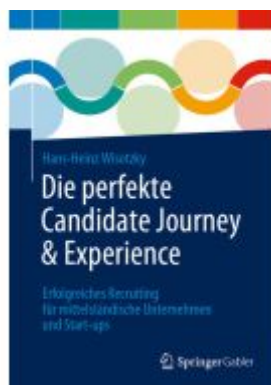
Die perfekte Candidate Journey & Experience Ladenpreis: 46,25EUR