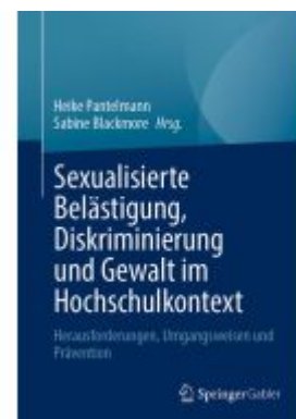
Sexualisierte Belästigung, Diskriminierung und Gewalt im Hochschulkontext Ladenpreis: 56,53EUR