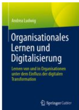
Organisationales Lernen und Digitalisierung Ladenpreis: 39,06EUR

Wir haben andere Produkte gefunden, die Ihnen gefallen könnten!