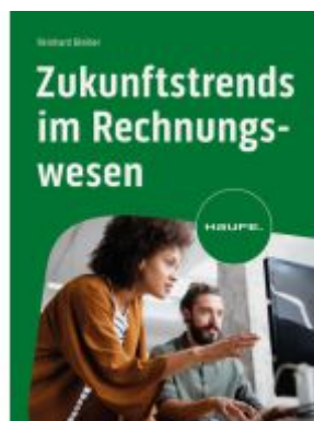
Zukunftstrends im Rechnungswesen Ladenpreis: 51,40EUR