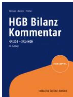
HGB Bilanz Kommentar 15. Auflage Ladenpreis: 255,00EUR