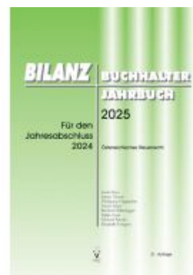
BILANZBUCHHALTER JAHRBUCH 2025 Ladenpreis: 60,39EUR