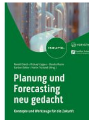
Planung und Forecasting neu gedacht Ladenpreis: 92,60EUR