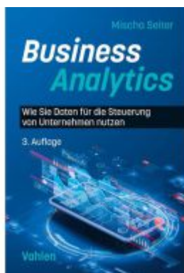
Business Analytics Ladenpreis: 51,20EUR