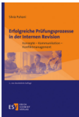
Erfolgreiche Prüfungsprozesse in der Internen Revision Ladenpreis: 56,50EUR