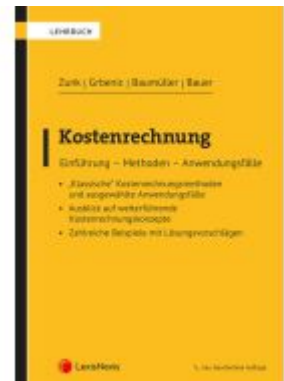
Kostenrechnung Ladenpreis: 48,00EUR