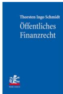
Öffentliches Finanzrecht Ladenpreis: 60,70EUR