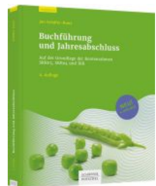
Buchführung und Jahresabschluss Ladenpreis: 36,00EUR