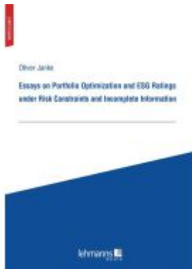
Essays on Portfolio Optimization and ESG Ratings under Risk Constraints and Incomplete Information Ladenpreis: 25,70EUR

Wir haben andere Produkte gefunden, die Ihnen gefallen könnten!