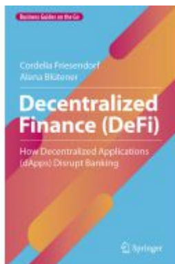
Decentralized Finance (DeFi) Ladenpreis: 87,99EUR