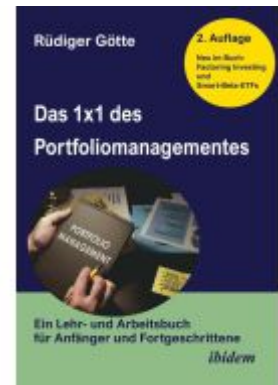
Das 1x1 des Portfoliomanagementes Ladenpreis: 32,80EUR