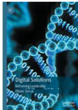
Digital Solutions Ladenpreis: 38,49EUR