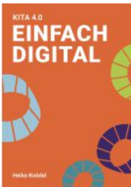
Kita 4.0 – einfach digital Ladenpreis: 30,80EUR