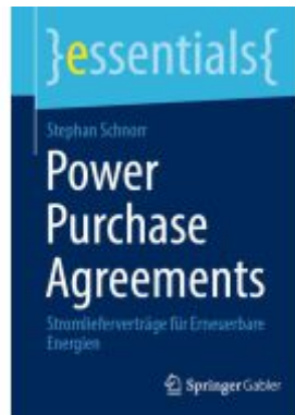
Power Purchase Agreements Ladenpreis: 15,41EUR