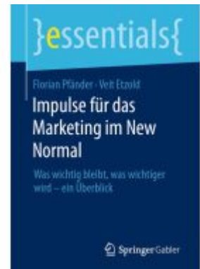
Impulse für das Marketing im New Normal Ladenpreis: 15,41EUR