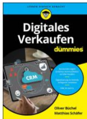
Digitales Verkaufen für Dummies Ladenpreis: 18,50EUR