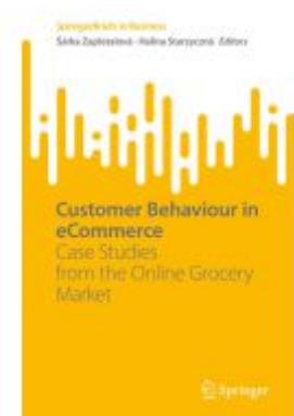
Customer Behaviour in eCommerce Ladenpreis: 54,99EUR