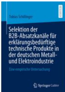
Selektion der B2B-Absatzkanäle für erklärungsbedürftige technische Produkte in der deutschen Metall- und Elektroindustrie Ladenpreis: 77,09EUR

Wir haben andere Produkte gefunden, die Ihnen gefallen könnten!