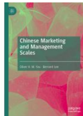
Chinese Marketing and Management Scales Ladenpreis: 131,99EUR