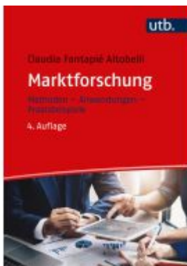
Marktforschung Ladenpreis: 65,80EUR