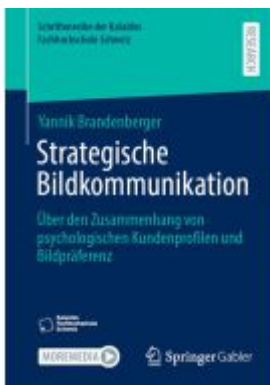
Strategische Bildkommunikation Ladenpreis: 71,95EUR