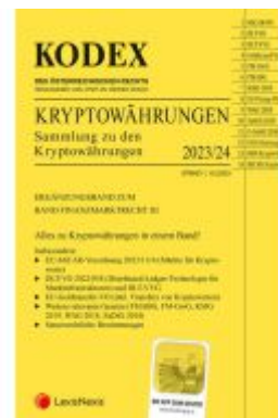
Kodex Kryptowährungen Ladenpreis: 30,00EUR