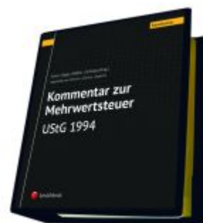
Kommentar zur Mehrwertsteuer - UStG 1994 Ladenpreis: 825,00EUR