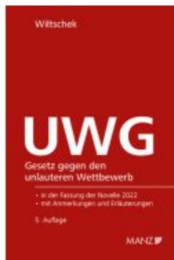
UWG Gesetz gegen den unlauteren Wettbewerb Ladenpreis: 68,00EUR