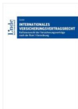
Internationales Versicherungsvertragsrecht Ladenpreis: 68,00EUR