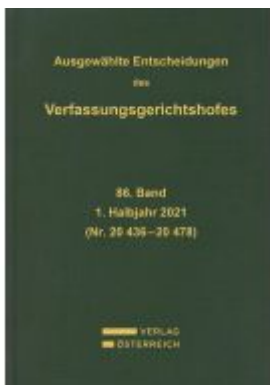
Ausgewählte Entscheidungen des Verfassungsgerichtshofes Ladenpreis: 419,00EUR