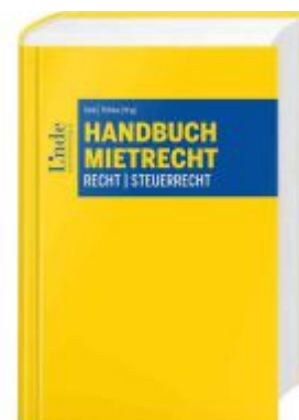
Handbuch Mietrecht Ladenpreis: 160,00EUR

Alle Preise inkl. MwSt. zzgl. Versand. Bei Bestellung im LexisNexis Onlineshop kostenloser Versand innerhalb Österreichs.