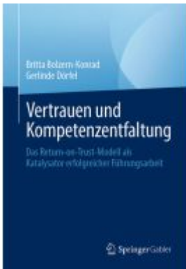
Vertrauen und Kompetenzentfaltung Ladenpreis: 46,25EUR