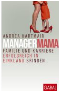
ManagerMama Ladenpreis: 28,80EUR