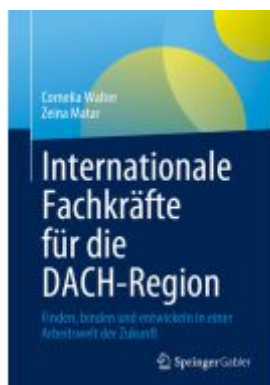
Internationale Fachkräfte für die DACH-Region Ladenpreis: 41,11EUR