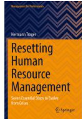
Resetting Human Resource Management Ladenpreis: 62,69EUR