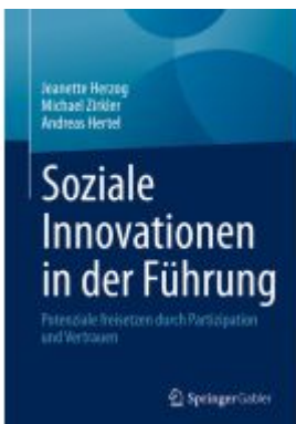
Soziale Innovationen in der Führung Ladenpreis: 35,97EUR

Wir haben andere Produkte gefunden, die Ihnen gefallen könnten!