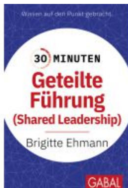
30 Minuten Geteilte Führung Ladenpreis: 11,30EUR