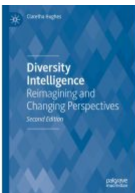
Diversity Intelligence Ladenpreis: 164,99EUR