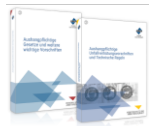
Das Aushang-Paket Ladenpreis: 99,80EUR