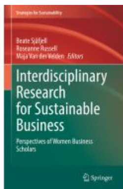
Interdisciplinary Research for Sustainable Business Ladenpreis: 164,99EUR