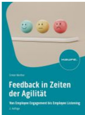
Feedback in Zeiten der Agilität Ladenpreis: 46,30EUR