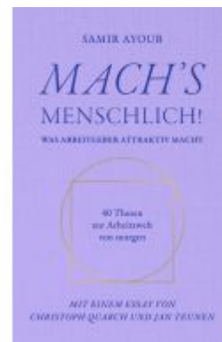
MACH'S MENSCHLICH! Ladenpreis: 20,00EUR