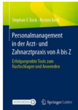
Personalmanagement in der Arzt- und Zahnarztpraxis von A bis Z Ladenpreis: 61,67EUR