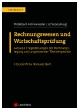
Rechnungswesen und Wirtschaftsprüfung – Festschrift für Romuald Bertl Ladenpreis: 198,00EUR