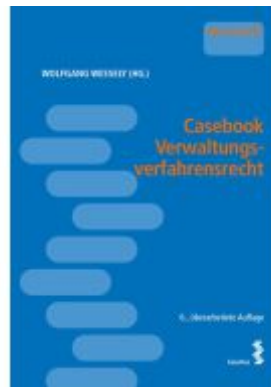
Casebook Verwaltungsverfahrenrecht Ladenpreis: 34,00EUR