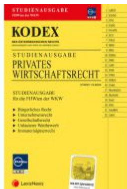
Kodex Privates Wirtschaftsrecht für die FH Wien der WKW - inkl. App Ladenpreis: 20,00EUR

Wir haben andere Produkte gefunden, die Ihnen gefallen könnten!