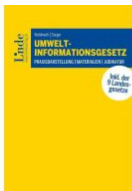
Umweltinformationsgesetz Ladenpreis: 39,00EUR