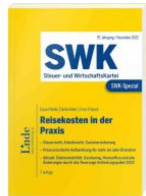
SWK-Spezial Reisekosten in der Praxis Ladenpreis: 39,00EUR