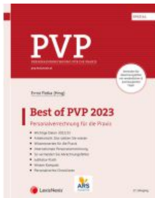
Best of PVP 2023 Ladenpreis: 34,00EUR