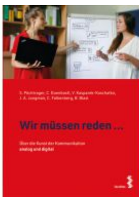
Wir müssen reden ... Ladenpreis: 9,90EUR