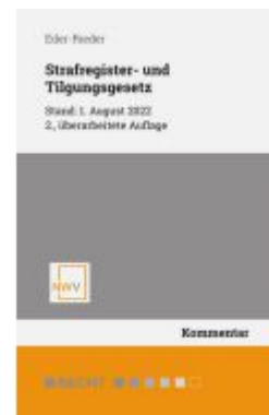
Strafregister- und Tilgungsgesetz Ladenpreis: 68,00EUR