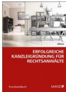
Erfolgreiche Kanzleigründung für Rechtsanwälte Ladenpreis: 34,00 EUR