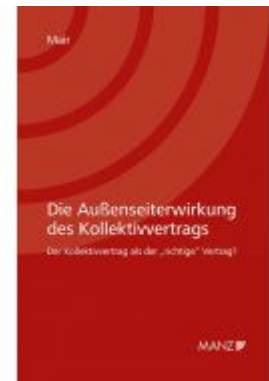
Die Außenseiterwirkung des Kollektivvertrags Ladenpreis: 98,00 EUR