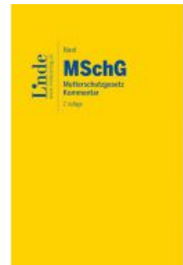
MSchG | Mutterschutzgesetz