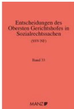
Entscheidungen des obersten Gerichtshofes in Sozialrechtssachen SSV- NF Ladenpreis: 139,20 EUR