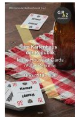
Im Kartenhaus der Republik. In the House of Cards of the Republic. Graz 1918-1938 Ladenpreis: 18,00 EUR