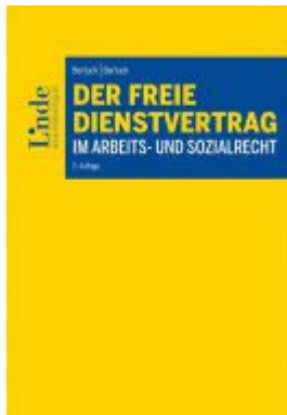
Der freie Dienstvertrag im Arbeits- und Sozialrecht