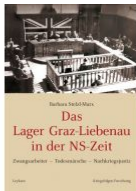
Das Lager Graz-Liebenau in der NS-Zeit Ladenpreis: 17,80 EUR