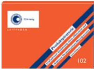
Produktpiraterie Ladenpreis: 257,10EUR