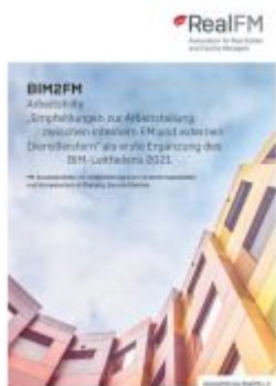
Arbeitshilfe „Empfehlungen zur Arbeitsteilung zwischen internem FM und externen Dienstleistern“ als erste Ergänzung des BIM-Leitfadens 2021 Ladenpreis: 115,50EUR