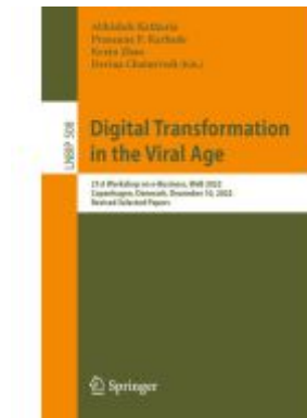
Digital Transformation in the Viral Age Ladenpreis: 120,99EUR