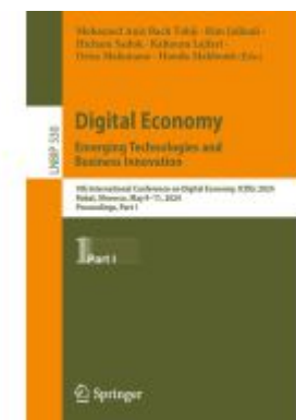
Digital Economy. Emerging Technologies and Business Innovation Ladenpreis: 142,99EUR