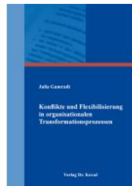
Konflikte und Flexibilisierung in organisationalen Transformationsprozessen Ladenpreis: 154,00EUR