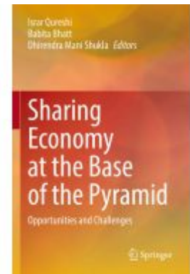
Sharing Economy at the Base of the Pyramid Ladenpreis: 186,99EUR