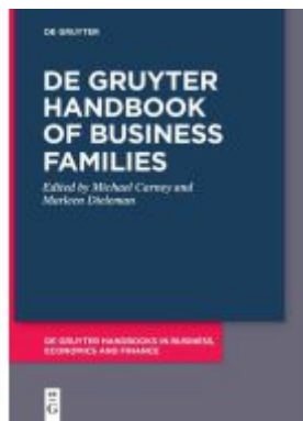
De Gruyter Handbook of Business Families Ladenpreis: 139,95EUR