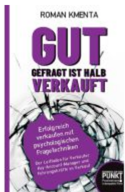
Gut gefragt ist halb verkauft Ladenpreis: 19,97EUR