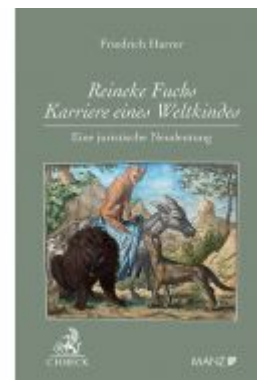
Reineke Fuchs - Karriere eines Weltkinder Eine juristische Neudeutung Ladenpreis: 19,00 EUR