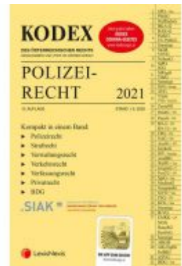
KODEX Polizeirecht 2021 Ladenpreis: 58,00 EUR