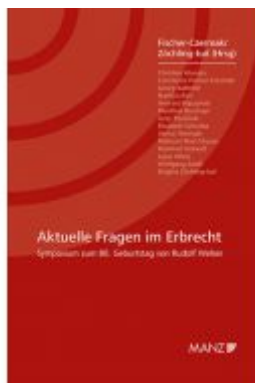
Aktuelle Fragen im Erbrecht Symposium zum 80. Geburtstag von Rudolf Weiser Ladenpreis: 34,80 EUR