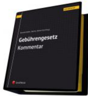
Gebührengesetz Kommentar Ladenpreis: 160,00 EUR