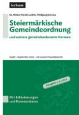
Steiermärkische Gemeindeordnung und weitere gemeinderelevante Normen Ladenpreis: 75,00 EUR