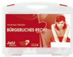
Medienkoffer Bürgerliches Recht Ladenpreis: 322,30 EUR