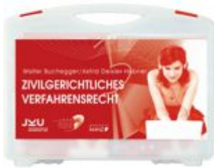
Medienkoffer Zivilgerichtliches Verfahrensrecht Ladenpreis: 280,50 EUR