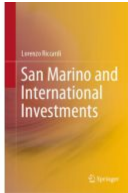
San Marino and International Investments Ladenpreis: 164,99EUR