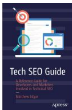
Tech SEO Guide Ladenpreis: 38,49EUR