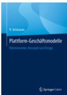
Plattform-Geschäftsmodelle Ladenpreis: 77,09EUR