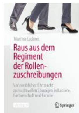
Raus aus dem Regiment der Rollenzuschreibungen Ladenpreis: 25,69EUR