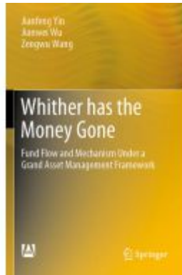
Whither has the Money Gone Ladenpreis: 131,99EUR