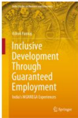
Inclusive Development Through Guaranteed Employment Ladenpreis: 131,99EUR