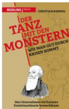
Der Tanz mit den Monstern – Wie man gut durch Krisen kommt Ladenpreis: 22,70EUR