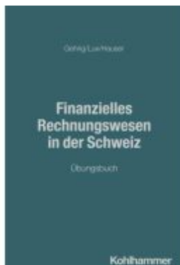
Finanzielles Rechnungswesen in der Schweiz Ladenpreis: 60,70EUR