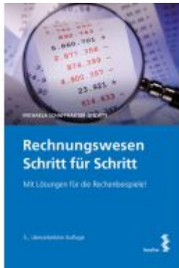
Rechnungswesen Schritt für Schritt Ladenpreis: 48,00EUR