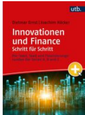
Innovationen und Finance Schritt für Schritt Ladenpreis: 28,70EUR