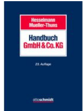
Handbuch GmbH & Co. KG Ladenpreis: 184,10EUR