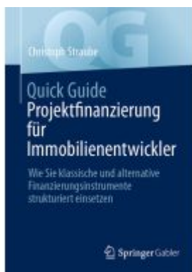
Quick Guide Projektfinanzierung für Immobilienentwickler Ladenpreis: 28,77EUR