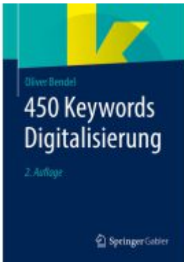
450 Keywords Digitalisierung Ladenpreis: 23,64EUR