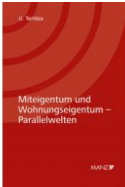
Miteigentum und Wohnungseigentum - Parallelwelten Ladenpreis: 132,00EUR