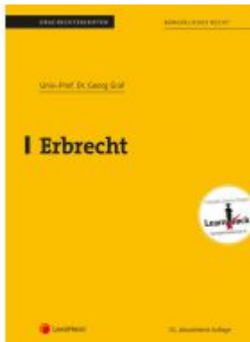
Erbrecht (Skriptum) Ladenpreis: 27,50EUR