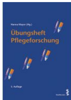
Übungsheft Pflegeforschung Ladenpreis: 16,90EUR