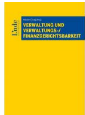
Verwaltung und Verwaltungs- /Finanzgerichtsbarkeit Ladenpreis: 98,00EUR