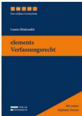
elements Verfassungsrecht Ladenpreis: 49,00EUR

Wir haben andere Produkte gefunden, die Ihnen gefallen könnten!