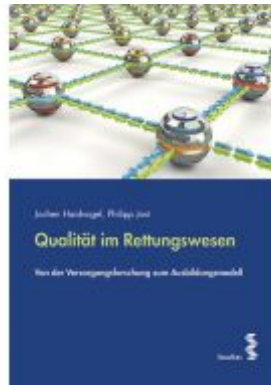
Qualität im Rettungswesen Ladenpreis: 21,90EUR