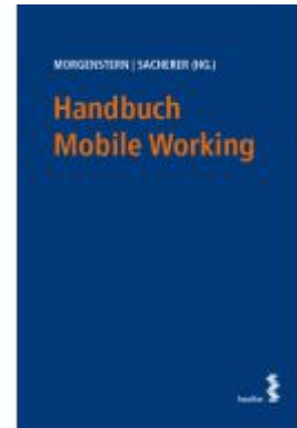
Handbuch Mobile Working Ladenpreis: 58,00EUR