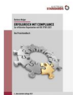
Erfolgreich mit Compliance Ladenpreis: 79,00EUR