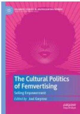
The Cultural Politics of Femvertising