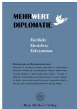
Mehrwert Diplomatie Ladenpreis: 15,50EUR