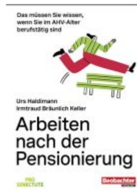
Arbeiten nach der Pensionierung Ladenpreis: 46,30EUR