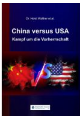
China versus USA Ladenpreis: 22,70EUR