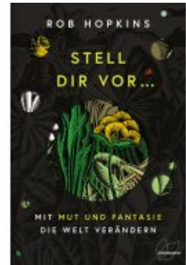
Stell dir vor ...