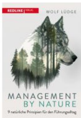
Management by Nature Ladenpreis: 25,80EUR

Wir haben andere Produkte gefunden, die Ihnen gefallen könnten!