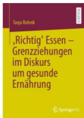
‚Richtig‘ Essen – Grenzziehungen im Diskurs um gesunde Ernährung Ladenpreis: 66,81EUR