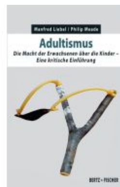
Adulthood Ladenpreis: 19,60EUR