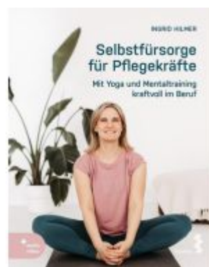
Selbstfürsorge für Pflegekräfte Ladenpreis: 24,90EUR