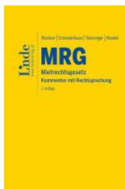
MRG | Mietrechtsgesetz Ladenpreis: 128,00EUR