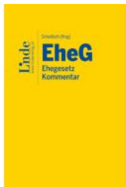
EheG | Ehegesetz Ladenpreis: 159,00EUR