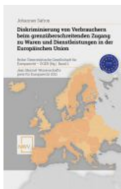
Diskriminierung von Verbrauchern beim grenzüberschreitenden Zugang zu Waren und Dienstleistungen in der Europäischen Union Ladenpreis: 88,00EUR