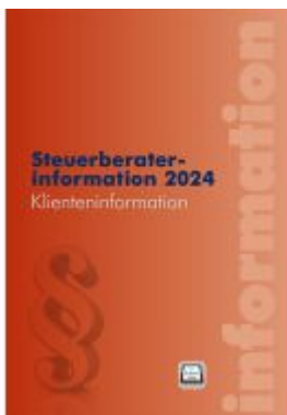
Steuerberaterinformation 2024 Ladenpreis: 52,00EUR

Wir haben andere Produkte gefunden, die Ihnen gefallen könnten!