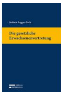
Die gesetzliche Erwachsenenvertretung Ladenpreis: 79,00EUR