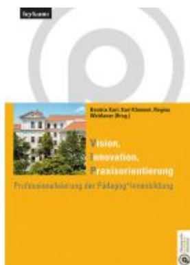
Vision Innovation Praxisorientierung Professionalisierung der Pädagog*innenbildung Ladenpreis: 35,00EUR