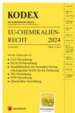
KODEX EU-Chemikalienrecht 2024 - inkl. App Ladenpreis: 99,00EUR