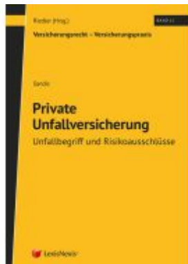
Private Unfallversicherung - Unfallbegriff und Risikoausschlüsse Ladenpreis: 74,00EUR