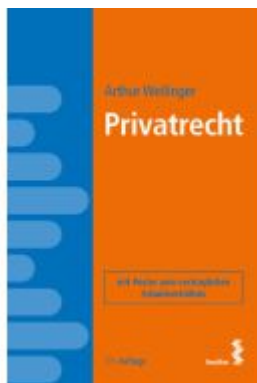
Privatrecht Ladenpreis: 48,00EUR