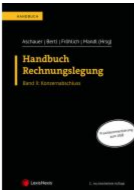
Handbuch Rechnungslegung / Handbuch Rechnungslegung, Band II: Konzernabschluss Ladenpreis: 99,00EUR

Wir haben andere Produkte gefunden, die Ihnen gefallen könnten!