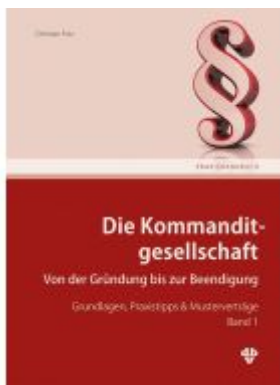
Die Kommanditgesellschaft Band 1 Ladenpreis: 78,00EUR