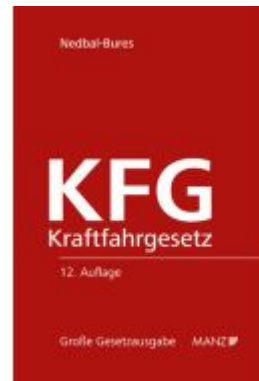
Kraftfahrzeuggesetz - KFG Ladenpreis: 138,00EUR