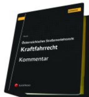
Österreichisches Straßenverkehrsrecht - Kraftfahrrecht Ladenpreis: 623,75EUR