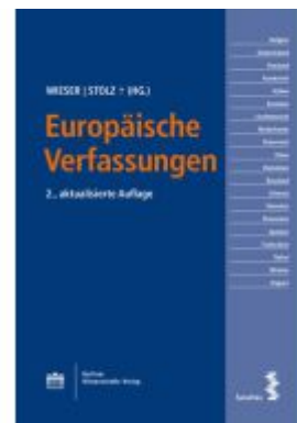
Europäische Verfassungen Ladenpreis: 36,00EUR