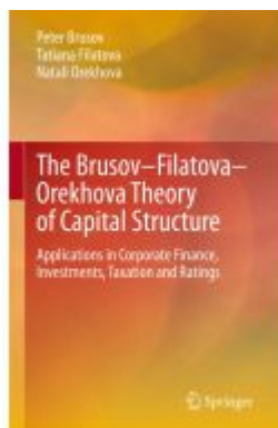
The Brusov-Filatova-Orehova Theory of Capital Structure Ladenpreis: 164,99EUR