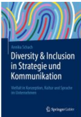
Diversity & Inclusion in Strategie und Kommunikation Ladenpreis: 56,53EUR

Wir haben andere Produkte gefunden, die Ihnen gefallen könnten!