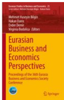
Eurasian Business and Economics Perspectives Ladenpreis: 164,99EUR