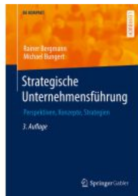
Strategische Unternehmensführung Ladenpreis: 61,68EUR