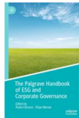
The Palgrave Handbook of ESG and Corporate Governance Ladenpreis: 186,99EUR