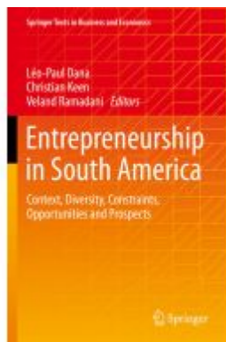
Entrepreneurship in South America Ladenpreis: 87,99EUR