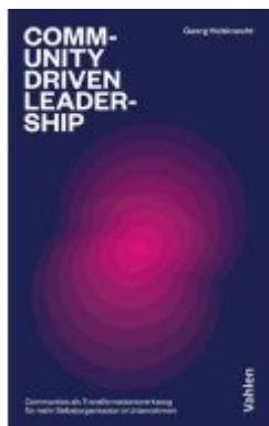
Community-driven Leadership Ladenpreis: 25,60EUR