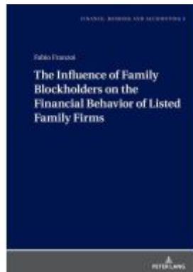
The Influence of Family Blockholders on the Financial Behavior of Listed Family Firms Ladenpreis: 46,20EUR