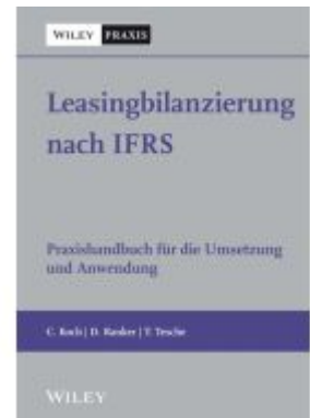
Leasingbilanzierung nach IFRS Ladenpreis: 51,30EUR