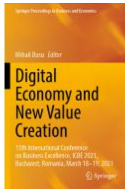
Digital Economy and New Value Creation Ladenpreis: 219,99EUR