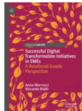
Successful Digital Transformation Initiatives in SMEs Ladenpreis: 49,49EUR