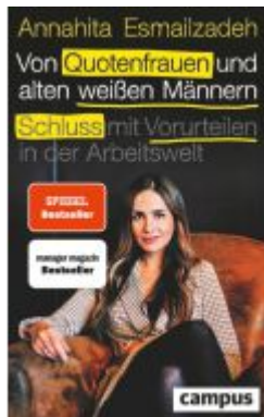
Von Quotenfrauen und alten weißen Männern Ladenpreis: 22,70EUR

Wir haben andere Produkte gefunden, die Ihnen gefallen könnten!