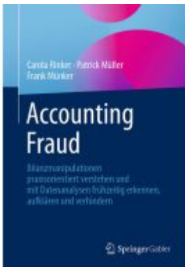
Accounting Fraud Ladenpreis: 46,26EUR