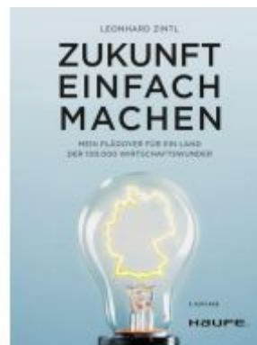
Zukunft einfach machen Ladenpreis: 30,90EUR