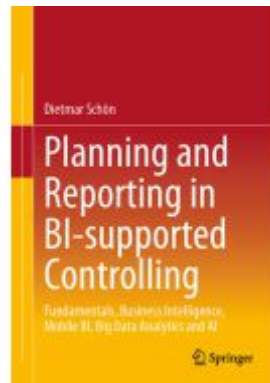
Planning and Reporting in BI-supported Controlling Ladenpreis: 76,99EUR