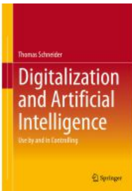
Digitalization and Artificial Intelligence Ladenpreis: 76,99EUR